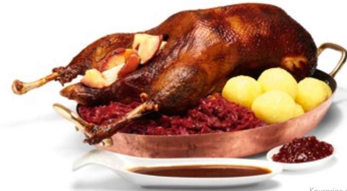
Knusprige gebratene bayerische Bio Gans Best.Nr. 105038