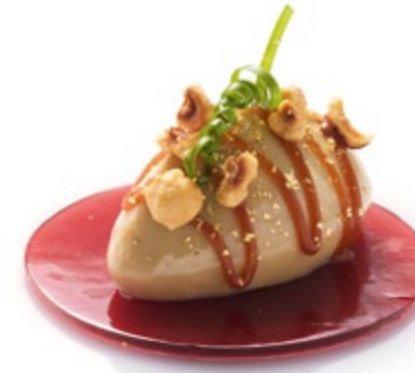
Faux Gras, Haselnuss, Portwein vegetarisch Best.Nr. 107318