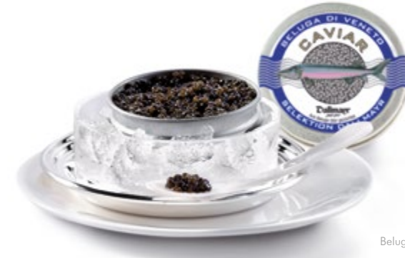
Beluga di Veneto Caviar