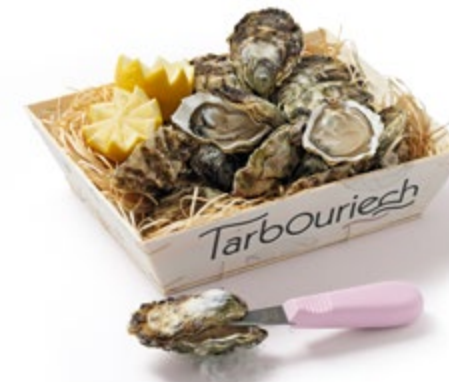
Austern Tarbouriech inkl. Austernöffner Best.Nr. 17054