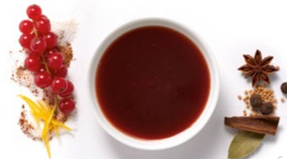
Cumberlandsauce Best.Nr. 2104