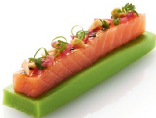
Lachs, Avocado, Passionsfrucht Best.Nr. 44980