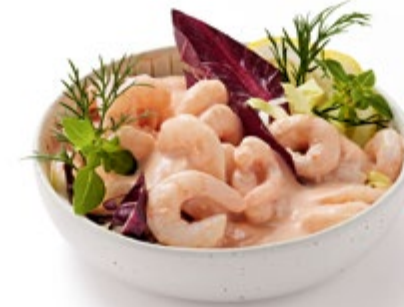
Shrimps in Cocktailsauce Best.Nr. 2042