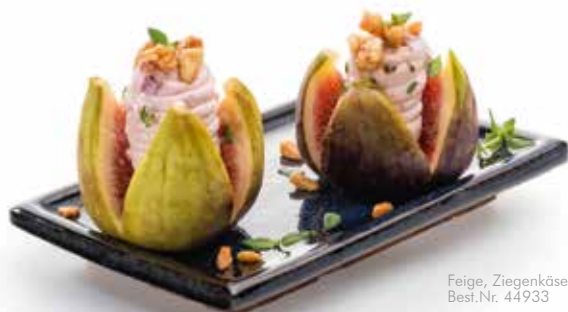
Feige, Ziegenkäse, Erdnuss Best.Nr. 44933