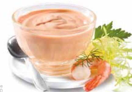
Cocktailsauce Best.Nr. 2110