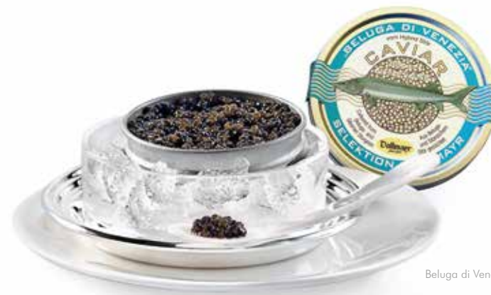
Beluga di Venezia Caviar