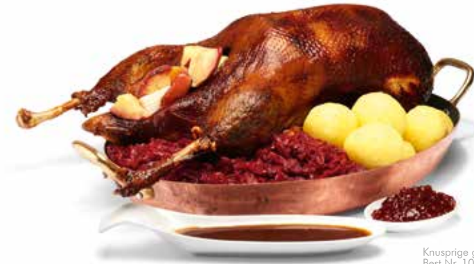
Knusprige gebratene Gans Best.Nr. 105038