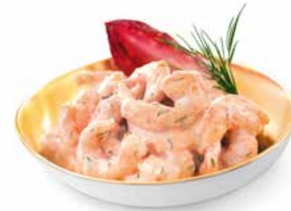
Shrimps in Cocktailsauce Best.Nr. 2042